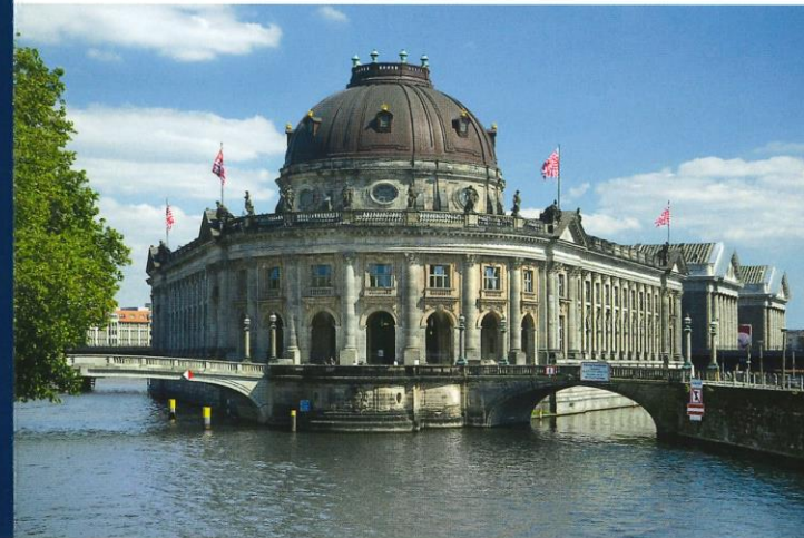
BODE-MUSEUM, FOTO: © ANTJE VOIGT – SMB-SKULPTURENSAMMLUNG